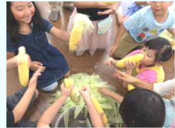
↑みんなでトウモロコシを むいて食べました！