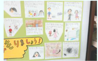
↑みんなで決めたルール